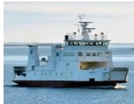
Både, der transporterer os mellem øerne