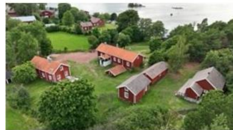
Små samfund - røde huse. Hemsløjd og hjemmelavede lækkerier

Færge til Brändö, med mulighed for at besøge små øerne Lappo, Enlige eller Jurmo. Turlængde 17 km Frokost: Galeasen på Lappo Middag: Hotell Gullivan. Overnatning: Hotell Gullivan.