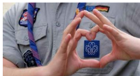
Spejder fra VCP