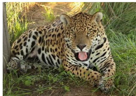
Jaguren "Nahuel" fra projektet i Argentina