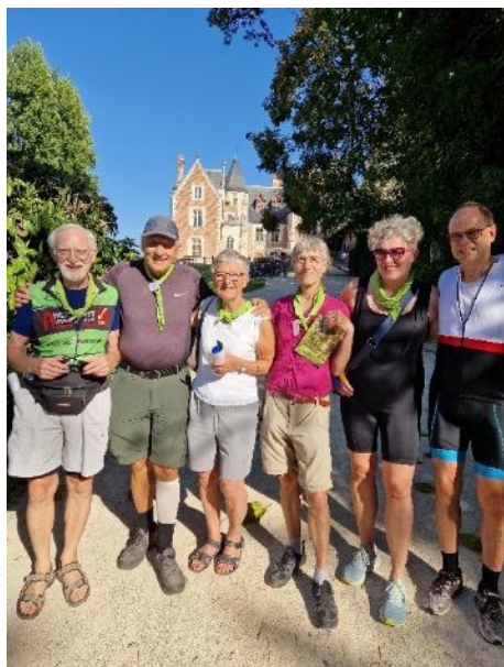
Cykelhold foran Clos Lucé