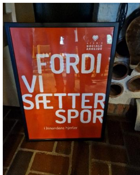
Motto for KFUM's sociale arbejde

KFUM's Sociale Arbejde og medlem af Frivillighedsrådet. Han fortalte om det meget omfattende arbejde, som KFUM's Sociale Arbejde står for. Det gjorde indtryk at høre om madudbringning til socialt isolerede personer en række steder, - om hjælp til at styre de små midler hos socialt udsatte, - om værestedet 'Paraplyen' i mange byer. I Paraplyen arbejder man på at brugerne af stedet skal/kan give en praktisk hånd med for at få stederne til at fungere. KFUM's Sociale Arbejde driver også 'børnehuse' for børn, der anbragt udenfor hjemmet. I øjeblikket arbejder de på et projekt, hvor unge over 18 år, som er 'flyttet hjemmefra', men som for en kortere periode har behov for en støttende hånd og et sted at bo.