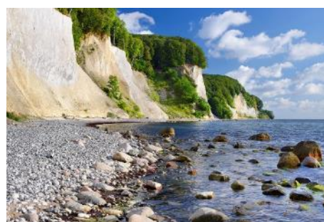
Kridtklinter på Rügen